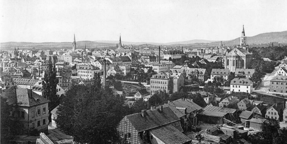
Liberec kolem roku 1900